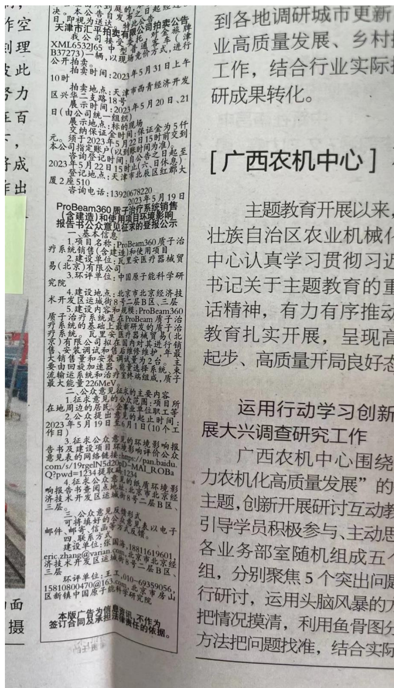
图 3-2 报纸公示的版面照片

可以满足报纸公示的需求，符合《环境影响评价公众参与办法》的要求，公示起止时间为2023年5月19日-2023年6月1日，报纸公示版面照片见下图。