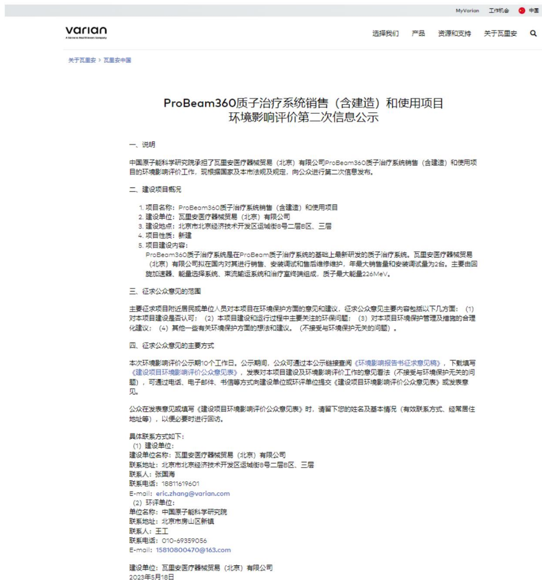
图 3-1 网络公示的网站截图

以满足公示需要，公示起止日期为 2023 年 5 月 18 日-2023 年 5 月 31 日，网络公示链接为： https://www.varian.com/zh-hans/about-varian/about-china/environmental-impact-assessment-disclosure-20230518 下图为网络公示的网站截图。